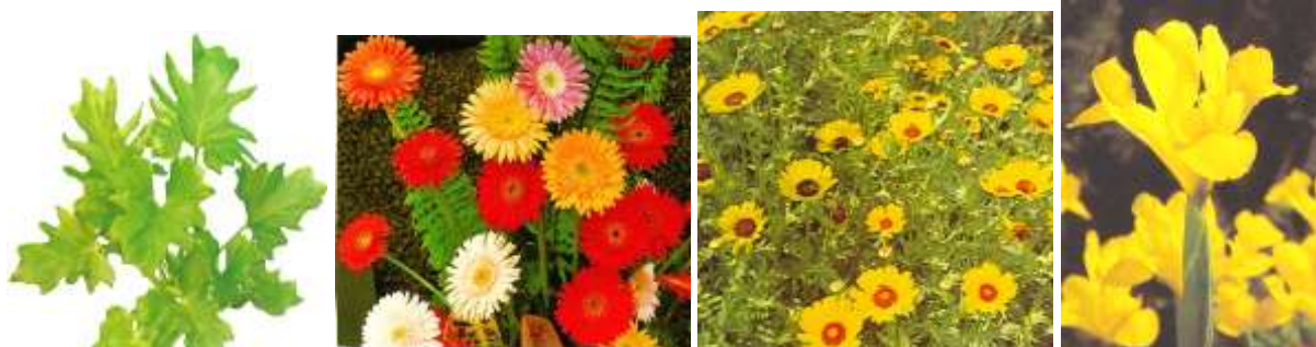
شكل ( 3 ) يوضح بعض نباتات الزينة التي لديها القدرة على امتصاص غاز الفورمالدهايد والبنزين وهم من اليمين الجولدن Golden Philodendron ، جيربيرا ديساي Gerbera Daisy ، فيلودندرون ، الكريزانثم Chrysanthemum ، Pothos