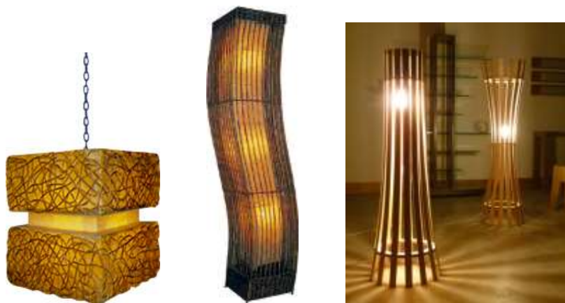
شكل (11) لوحدة إضاءة تم تنفيذها من هيكل معدني مع شرائح رقيقة من خشب الخيزران ( www.americanbamboo.org )