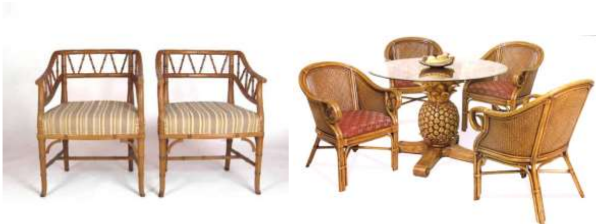
شكل ( 9 ) لبعض الكراسي التي تم تنفيذها من هيكل من خشب الخيزران ثم تمت تكسيتهما بشرائح من الخيزران بعد نقشه وتقطيعه إلى

شرايح رفيعة تقبل الثني . ( www.bamboohardwoods.com )