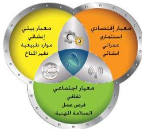
شكل (1) يوضح محاور الاستدامة