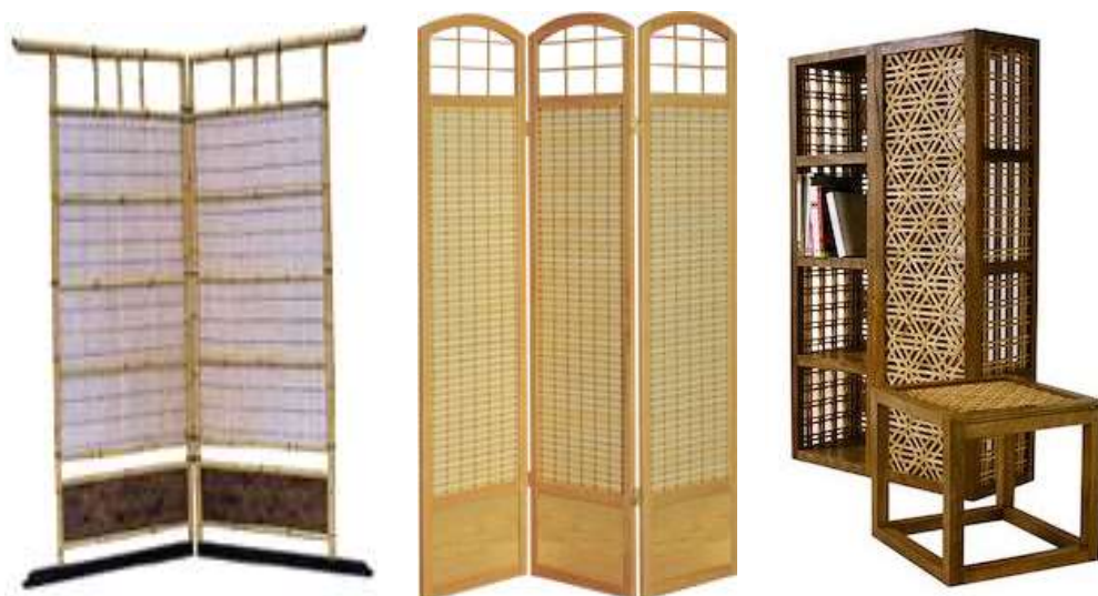
شكل ( 10 ) لوحدة تخزين وقاطوع تم تنفيذهم الاطار الخارجي من الخشب الطبيعي والحشوات من خشب البامبو Bamboo