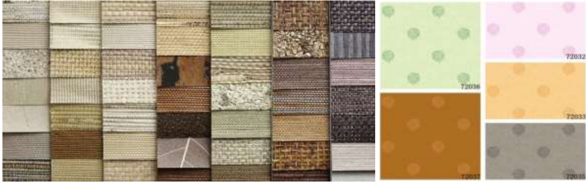
شكل ( 8 ) يوضح عينات مختلفة في الألوان والملمس لورق الحائط الطبيعي Natural Wall Covering